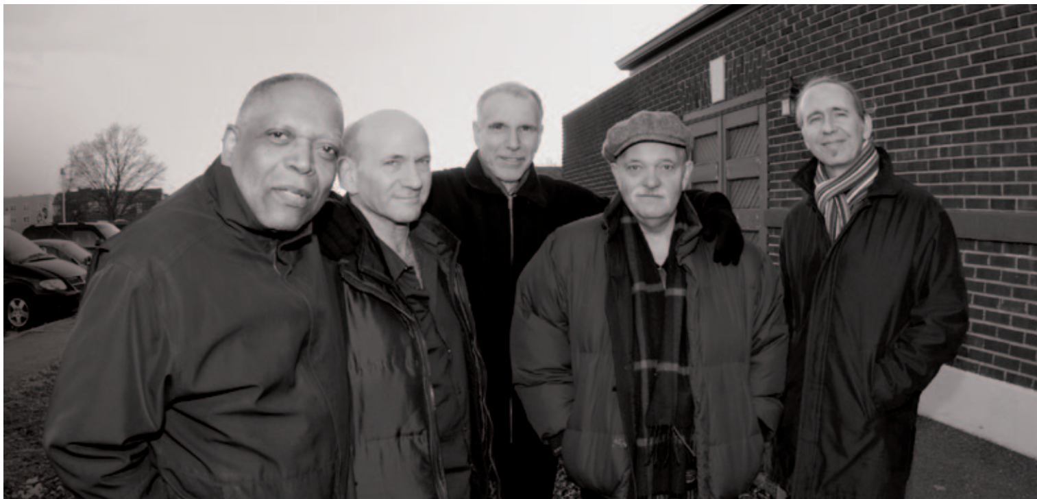
CONTACT · v.l.n.r.: Billy Hart, Dave Liebman, Marc Copland, John Abercrombie, Drew Gress